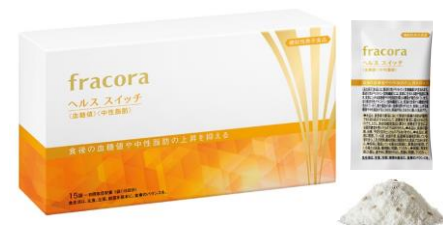
ヘルス スイッチ <血糖値><中性脂肪>

関与成分である難消化性デキストリンを食事と一緒に摂取すると、食後の血糖値上昇をおだやかにします。また、脂肪の吸収を遅くし、食後の中性脂肪の上昇を制御します。水溶性食物繊維である難消化性デキストリンは便通の改善にも役立つことが分かっています。