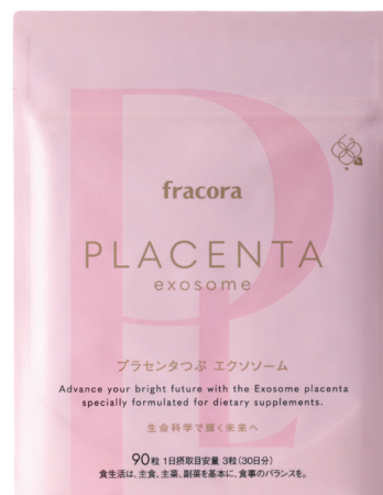
『プラセンタつぶ エクソソーム』