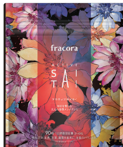
『アクティブサイタイ』