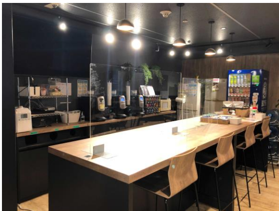
会議スペースのアクリル板の設置