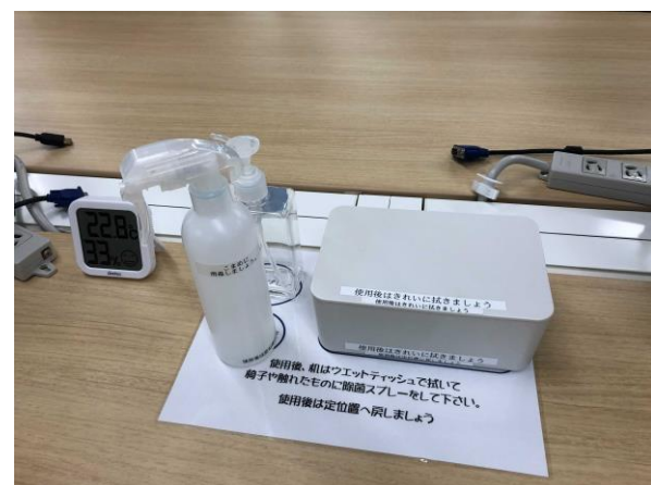
手の届く範囲に消毒スプレーなどの設置