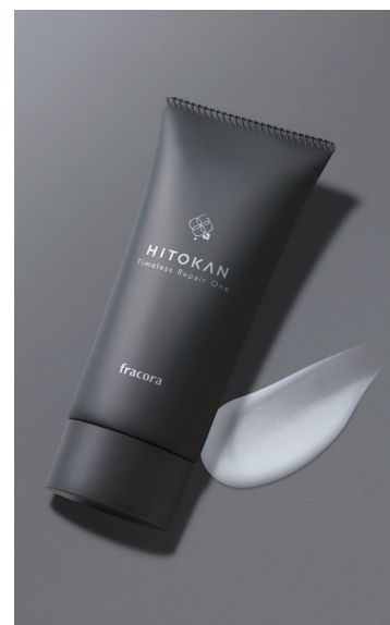
『HITOKAN タイムレスリペアワン GR』

未知の可能性を秘めたヒト幹細胞。そのメカニズムを解明し、より美容機能に優れた製品を開発するため、フラコラでは2020年から「ヒト幹細胞」の研究を続けています。